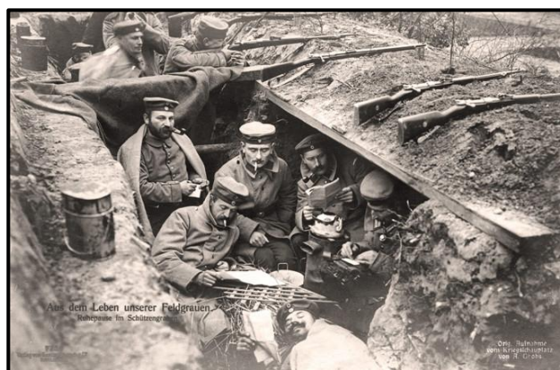
Aus dem Leben unserer Feldgrauen Kampagne im Schützengraben

Si è trattato di un evento che ha inoltre fatto conoscere il paese a diverse persone che finora non lo conoscevano e pertanto esso ha costituito una bella opportunità per Azeglio.